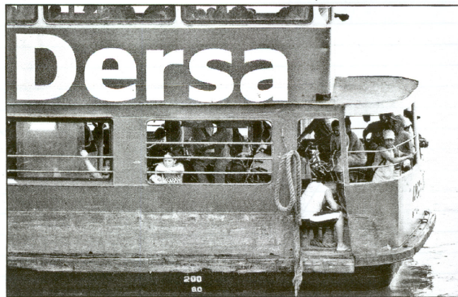
Hoje, o tempo médio de uso das barcas em operação entre Santos e Vicente de Carvalho é de 32 anos